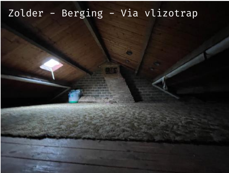
Zolder - Berging - Via vlizotrap