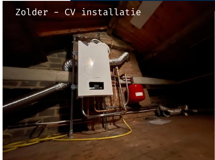
Zolder - CV installatie